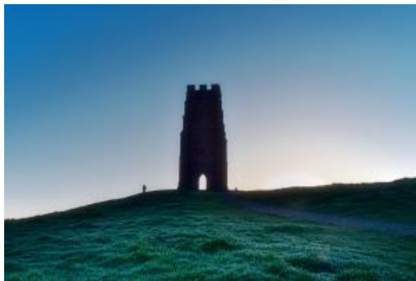
15 - St. Michael_2