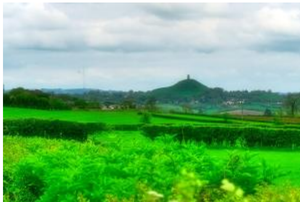
19 - Der Tor aus ca. 8 Km Entfernung