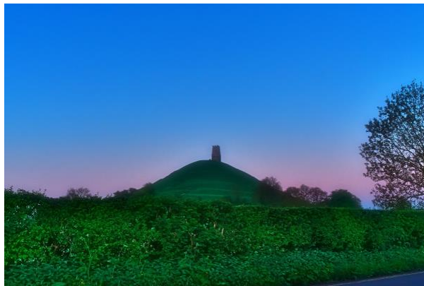
1 - Vor Sonnenaufgang