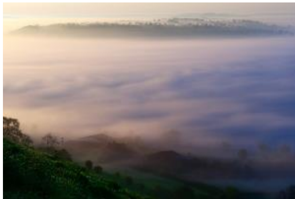
12 - Morgennebel_2