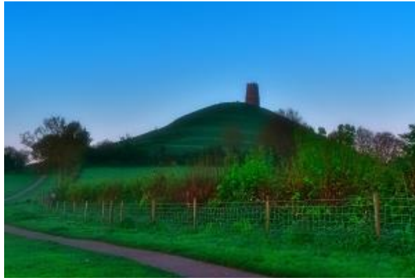
3 - Der Glastonbury Tor von Ost