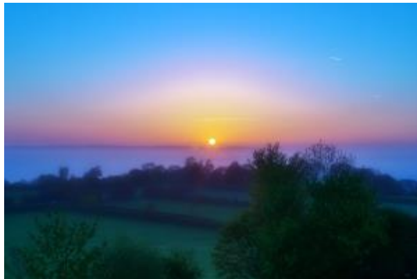
4 - Sonnenaufgang_1