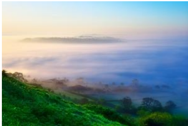
11 - Morgennebel_1