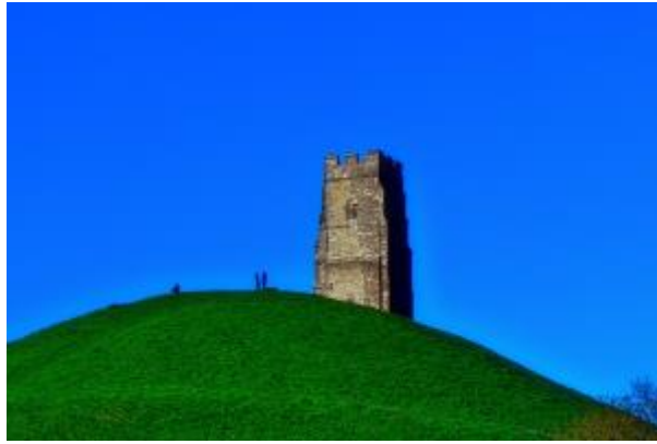
17 - Der Tor nach Sonnenaufgang_1