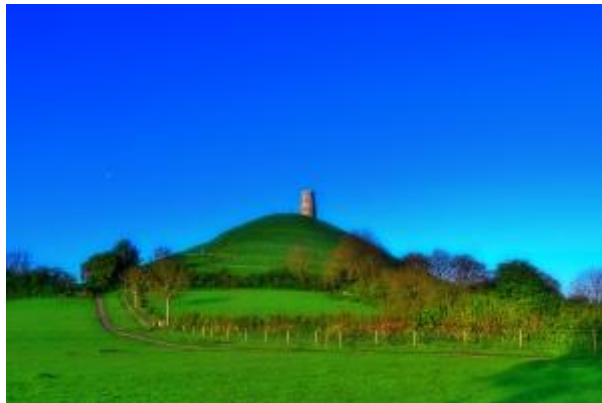
18 - Der Tor nach Sonnenaufgang_2