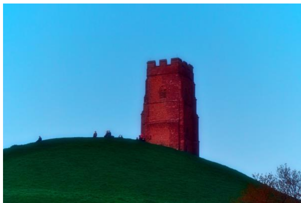
2 - Schaulustige erwarten den Sonnenaufgang