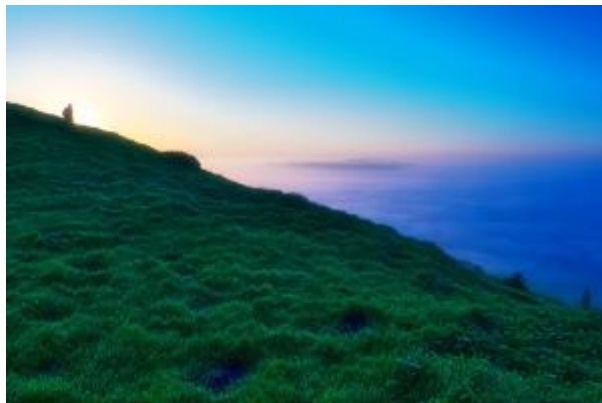
9 - Der Tor und Morgenebel überm Tal