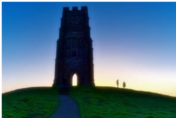
8 - St. Michael und zwei Schaulustige