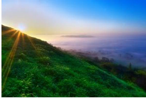
10 - Sonnenaufgang und Morgennebel