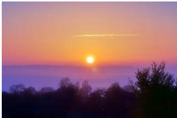
5 - Sonnenaufgang_2