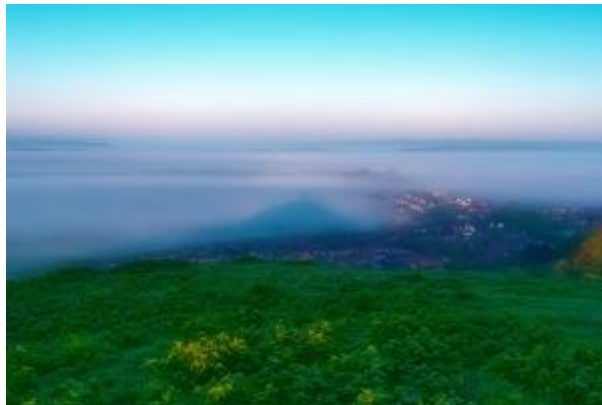
14 - Glastonbury Stadt, mit Silhouette des Tors und Nebel soweit das Auge reicht