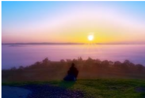
7 - Sitzende Frau und Sonnenaufgang