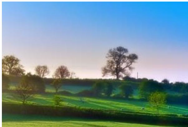
16 - Landschaft am Fuße des Tor